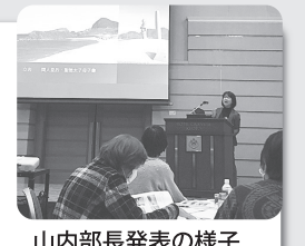
山内部長発表の様子

第2回京都府商工会女性部リーダー研修会が、2月16日にホテルグランヴィア京都で開催されました。都道府県を超えた女性部間交流の促進を目的に各地域のおもてなし交流プラン作成を京都府商工会女性部連合会が進めており、今回のリーダー研修では、プラン作成に向けた取り組み状況について府内の女性部長が発表を行いました。