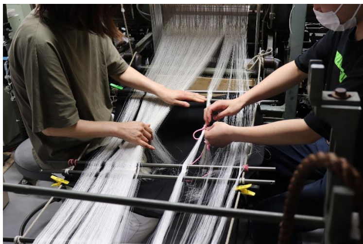
製織準備【たて継ぎ（手つなぎ）】コース