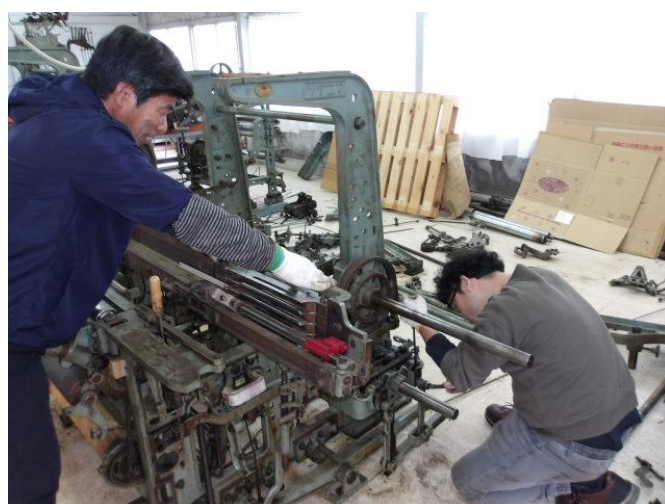
織機調整【分解・組立】コース