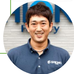
塩野代表取締役社長