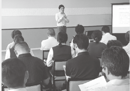
▲観光まちづくり勉強会の様子

9月11日(水) 網野町の“シーサイド佐竹”を会場として「観光まちづくり勉強会」を開催しました。6回目となる今回は、宿泊業に携る事業所より27名の方に参加をいただき「消費者心理をくすぐる-松竹梅戦略を使ったWEB集客」をテーマとして勉強会を行いました。講師に株式会社 to make (集客アドバイザー)